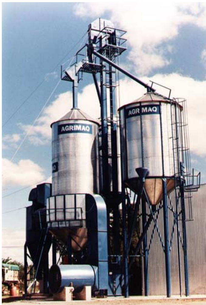
Secadora de semillas fabricada por AGRIMAQ.

En 2010, el 98% de nuestra facturación fue al exterior. Ya hemos superado las 300 exportaciones, y hemos instalado más de 1000 secadoras y otros productos en Argentina, Uruguay, Paraguay, Chile, Venezuela, Bolivia, Costa Rica, Honduras, Colombia, República Dominicana, Nicaragua y Panamá.