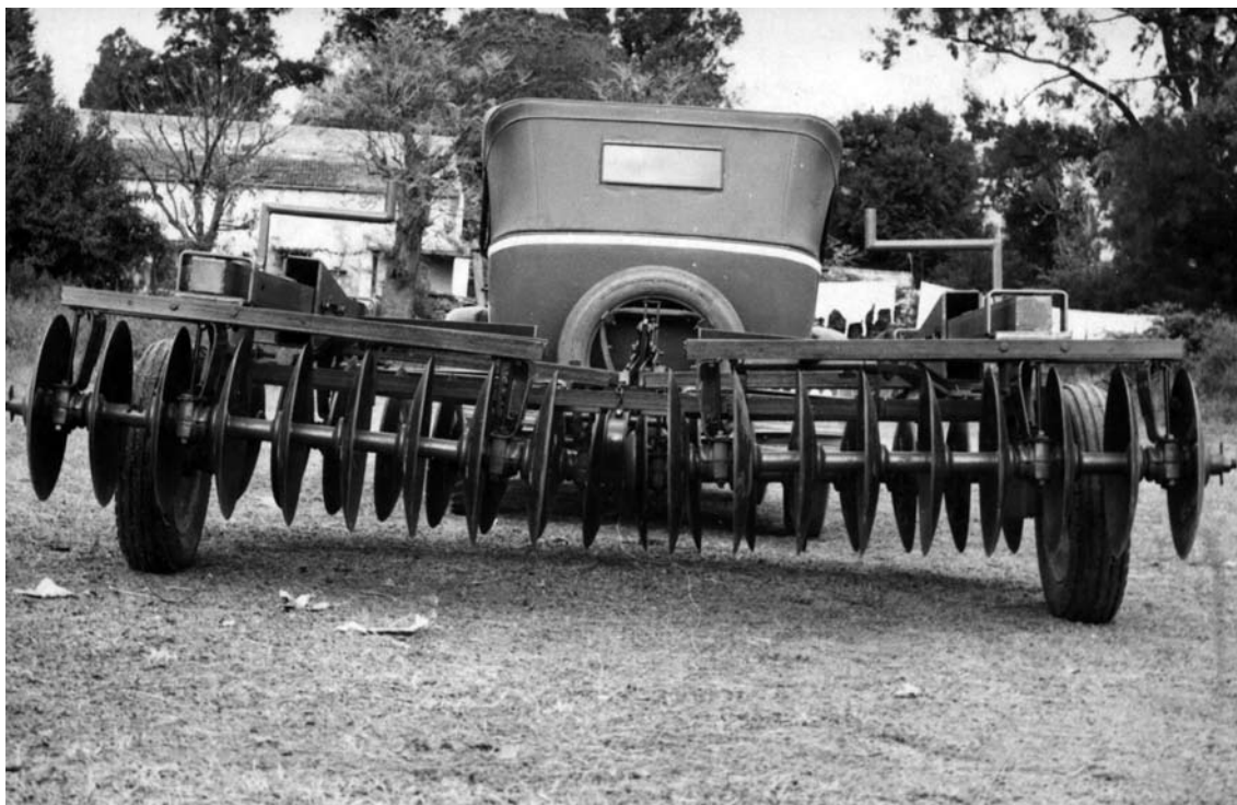
El Chevrolet 29 con el que repartíamos las máquinas en nuestros comienzos.

En 1965, el gobierno decidió finalizar una política de exenciones impositivas para la maquinaria agrícola y la demanda cayó abruptamente. Teníamos que reinventarnos. Por sugerencia de un vendedor, emprendimos la fabricación de secadoras de granos portátiles y fijas. Abandonamos todas las demás maquinarias para concentrarnos en nuestro rubro actual.