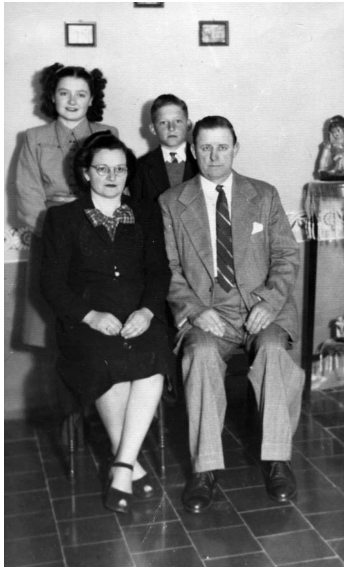
Con mis padres y hermana.

Nuestra situación se complicó cuando mi padre contrajo una enfermedad y tuvo que ser internado en Córdoba, por varios años. Sentimos mucho su ausencia, tanto en la parte afectiva como en la económica. Yo mismo armaba mis juguetes