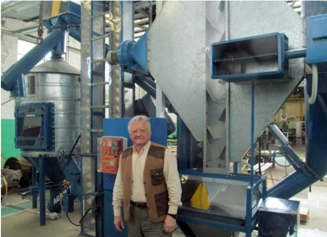
En la planta experimental de secado de granos de la empresa.