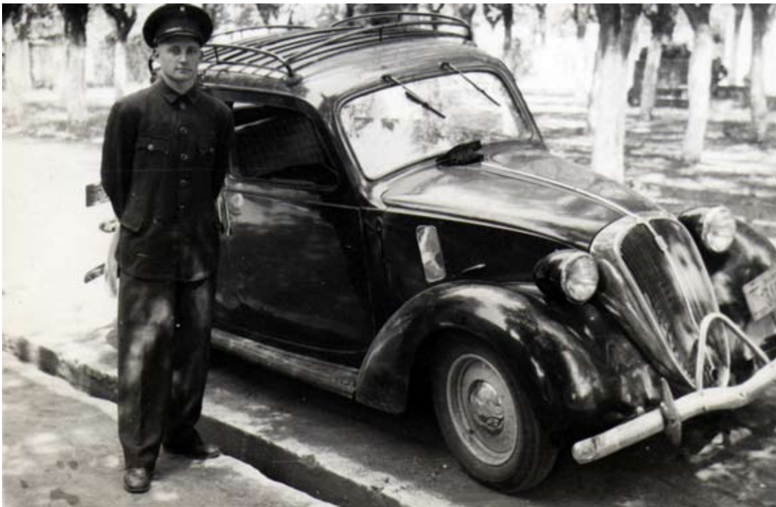
Durante el servicio militar, con mi uniforme de chofer.

con retazos de madera que me regalaban en la carpintería frente a mi casa, y jugaba al fútbol descalzo para no romper mis zapatillas. Mientras cursaba la primaria, colaboraba con la economía familiar repartiendo hielo y pan, y me ganaba la entrada al cine pegando carteles.