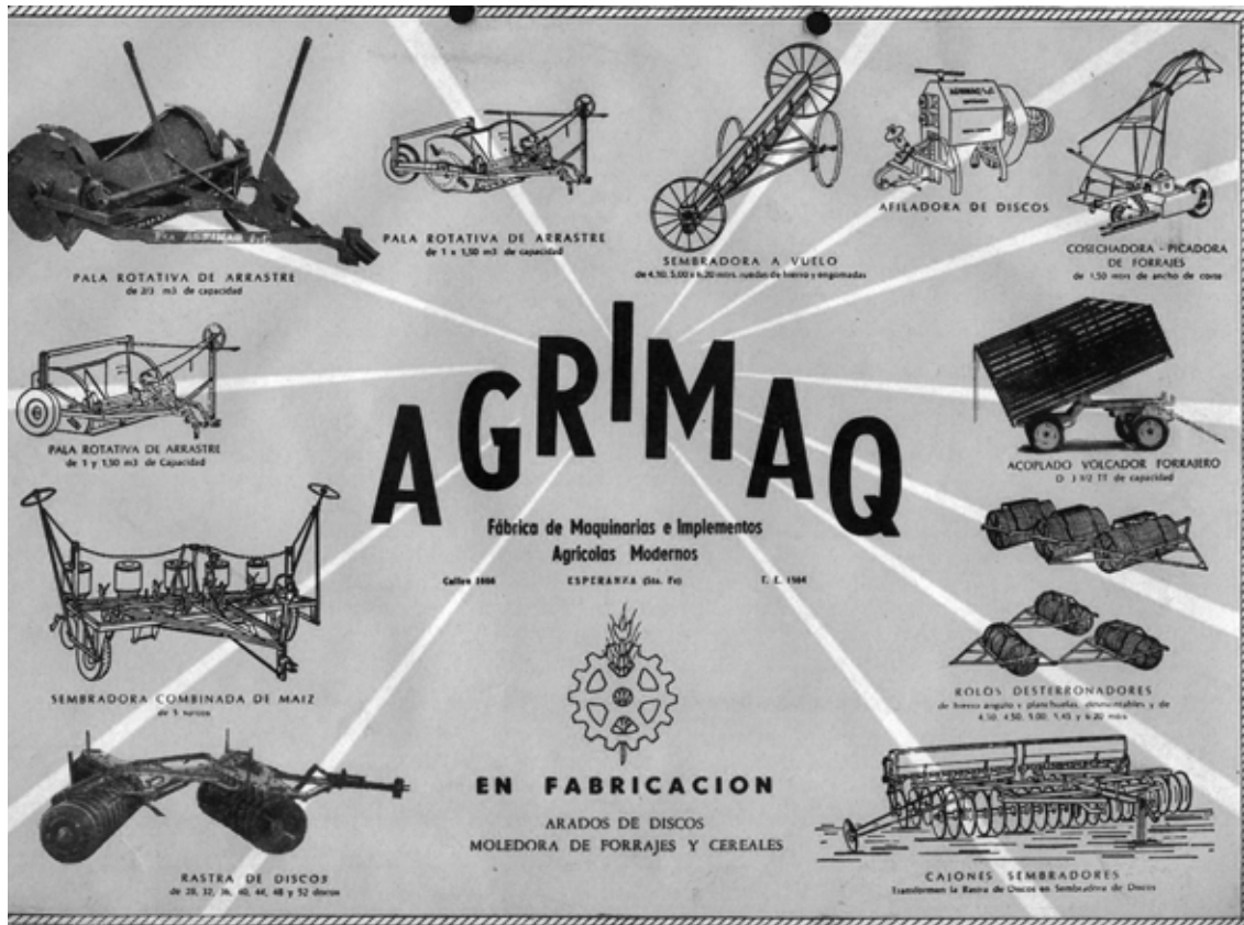
Un folleto con los productos de AGRIMAQ. Década de 1960.

empresa. Salí agresivamente a buscar nuevos mercados en el exterior. Depender sólo de la Argentina era cada vez más riesgoso.