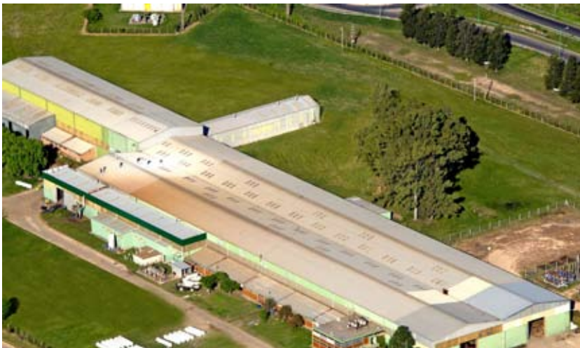
Nuestra planta de 12000 m 2 cubiertos en Gualeguaychú.

de equipos petroleros del país y principal proveedor de YPF y Pan American Energy, entre otras firmas del rubro.