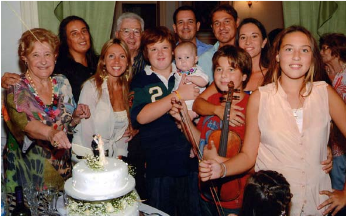
Celebrando mis 50 años de casado, rodeado de mis hijos y nietos.