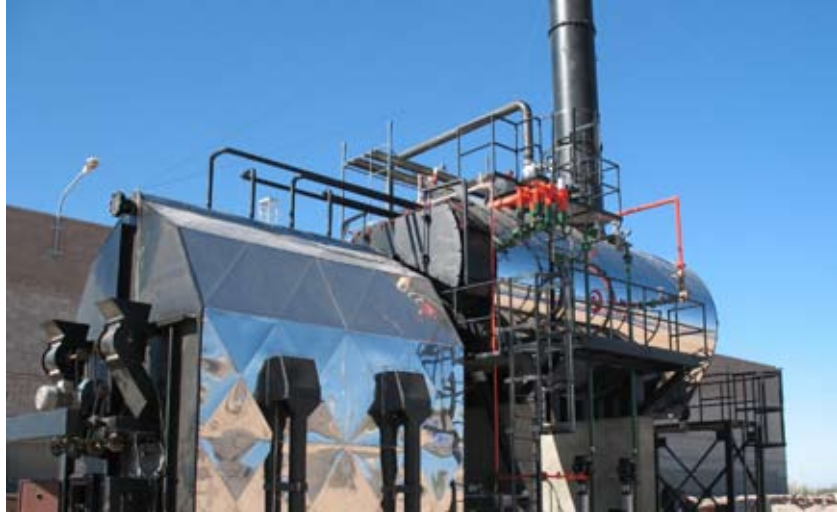
Uno de nuestros equipos petroleros.