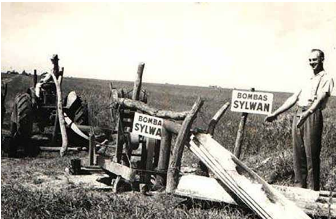
Los comienzos de Bombas Sylwan.