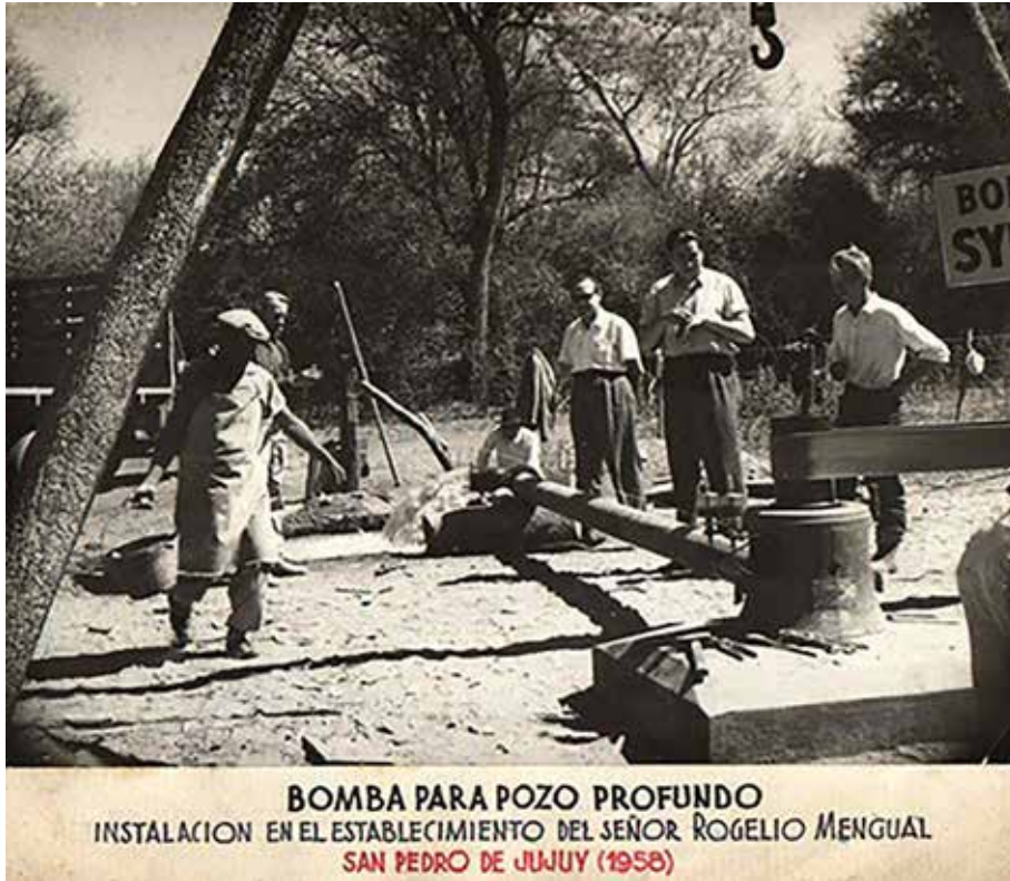
Instalación de bomba para pozo profundo. 1958.