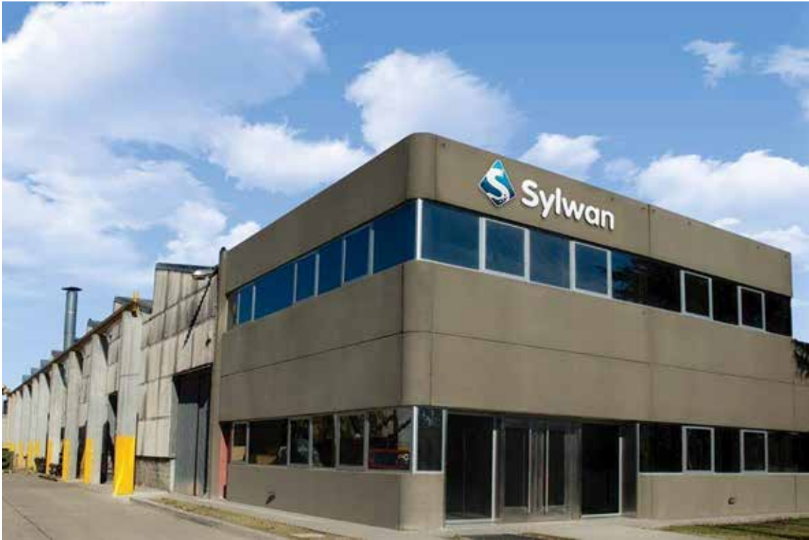
Nuestra planta actual.

Con una trayectoria de más de 80 años, somos uno de los principales referentes del mercado.