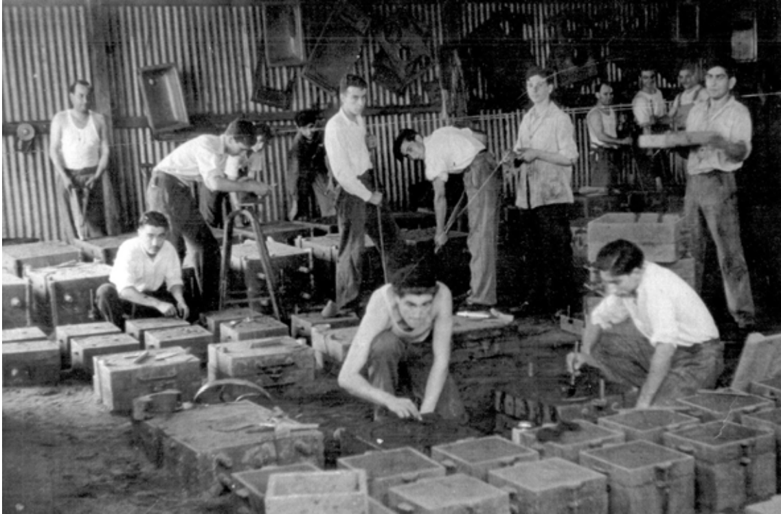
La fundición de Cirigliano, en los primeros tiempos.