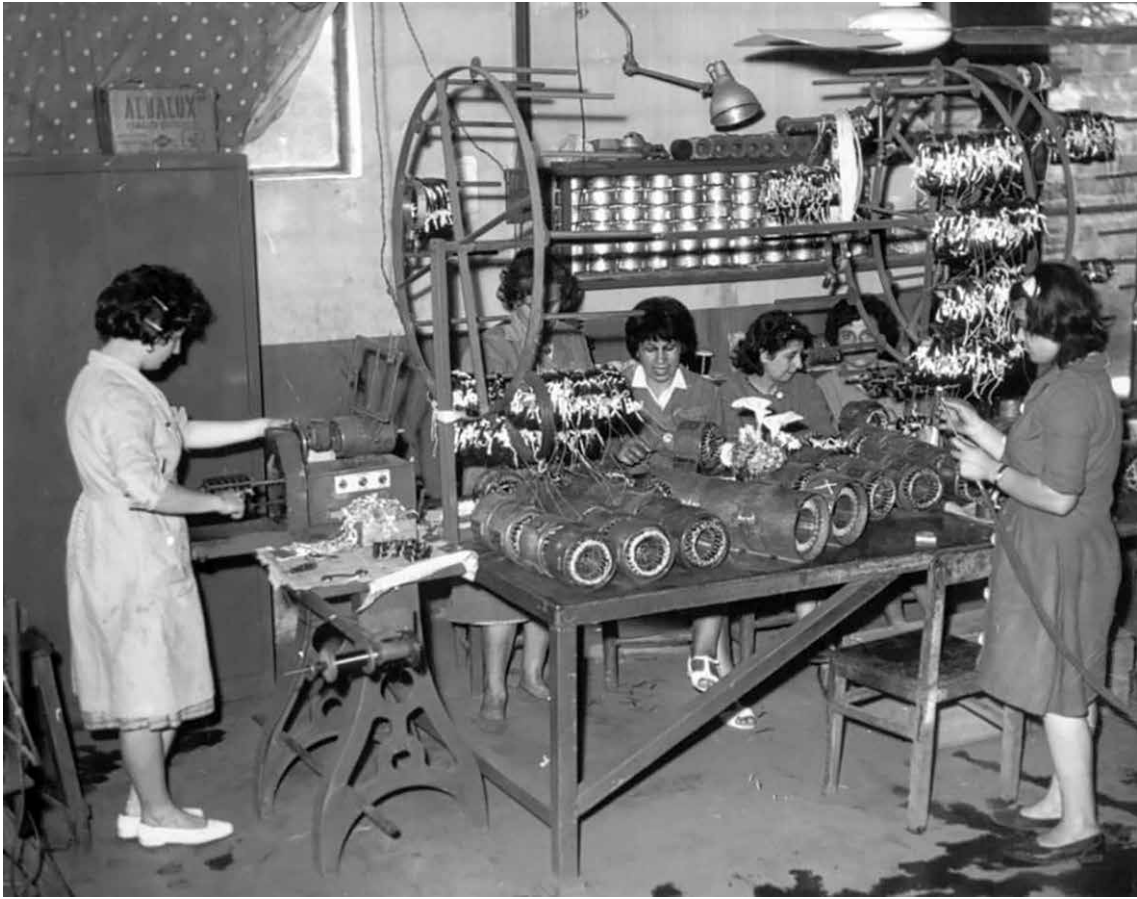
Desde los inicios, la mujer tuvo presencia en la fábrica.

A raíz de un castigo que recibió en la escuela, le dijo a Vicente que no quería estudiar más. Así que empezó a ayudarlo vendiendo leche al pie de la vaca que ordeñaba. Con las primeras monedas que pudo juntar, compró libros. Un primo mayor asumió la responsabilidad de enseñarle a leer y a escribir.