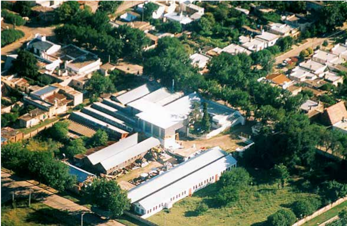
La planta de Cirigliano en Junín.

Fui viviendo las distintas etapas de la empresa en la cambiante economía nacional. En cada etapa aprendíamos cosas nuevas e incorporábamos nuevos conocimientos.