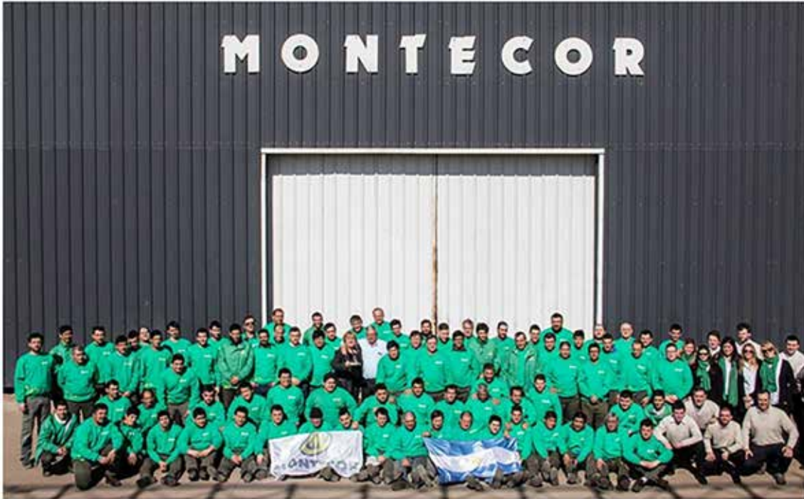
Montecor, una empresa para confiar.