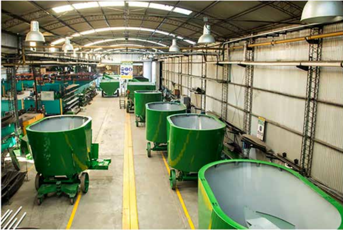
Interiores de la planta