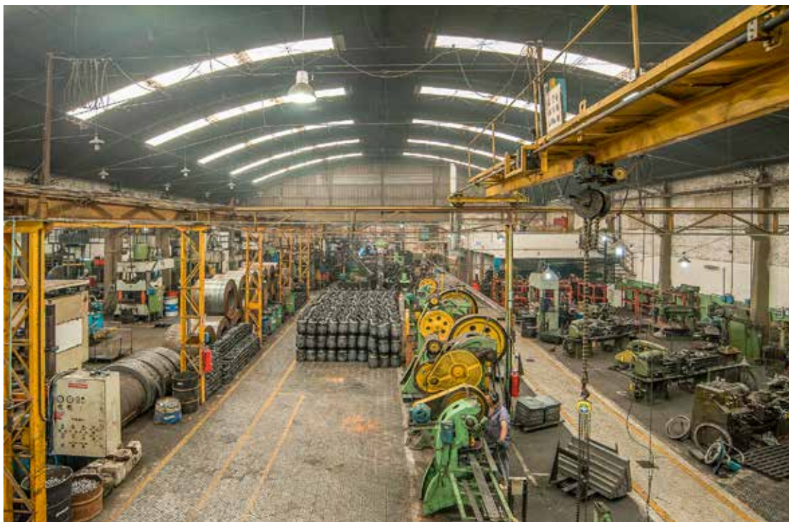
Vista general de la planta de fabricación de garrafas, llantas agroindustriales y pisos metálicos en Rosario. Año 2017.

de Petróleo, llantas para el sector agrícola y pisos metálicos industriales de alto tránsito.