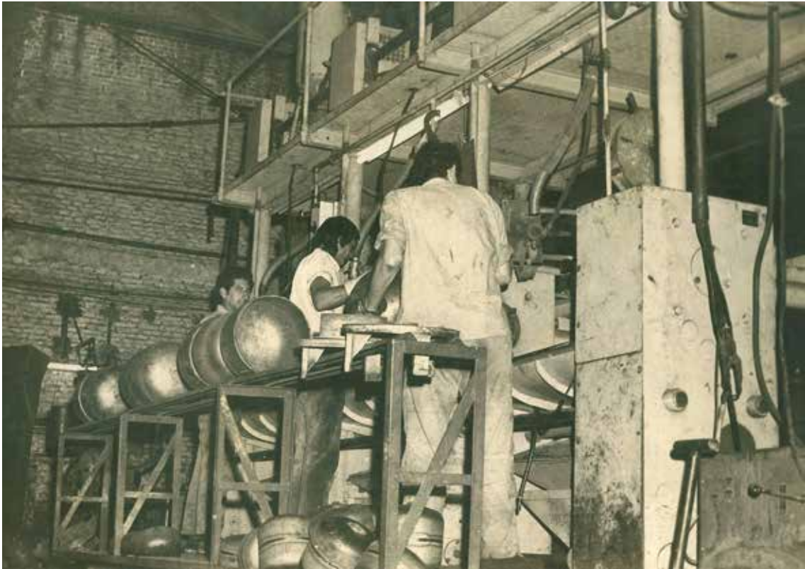
Cabezales para soldadura de arco sumergido de garrafas. Año 1972.

Corría 1960 y Gas del estado planeaba reemplazar el carbón y querosén por gas butano. Eso generaba la necesidad de envasar el gas. Nacía un nuevo mercado para la fabricación de envases y venta de gas. Así, siempre dentro de la industria metalúrgica, se cambió de rumbo y se comenzó con la fabricación de garrafas para Gas Licuado de Petróleo (GLP).