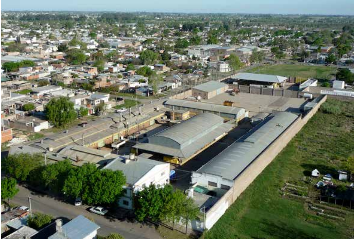
Vista aérea de la planta de reparación y terminación de garrafas en Rosario. Año 2011.

La crisis del 2001 casi nos deja fuera del mercado y una de las empresas de la competencia quebró. En esa época teníamos la responsabilidad de mantener el empleo a unos ochenta empleados, pero no teníamos trabajo.