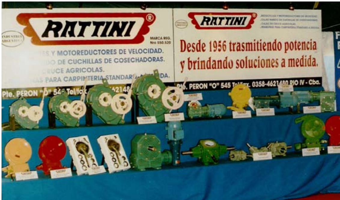
Muestra de productos de Rattini.